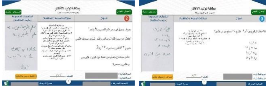
شكل (2): نماذج من المرحلة (2) تساؤلات المعلمة واستجابات المجموعة الثنائية