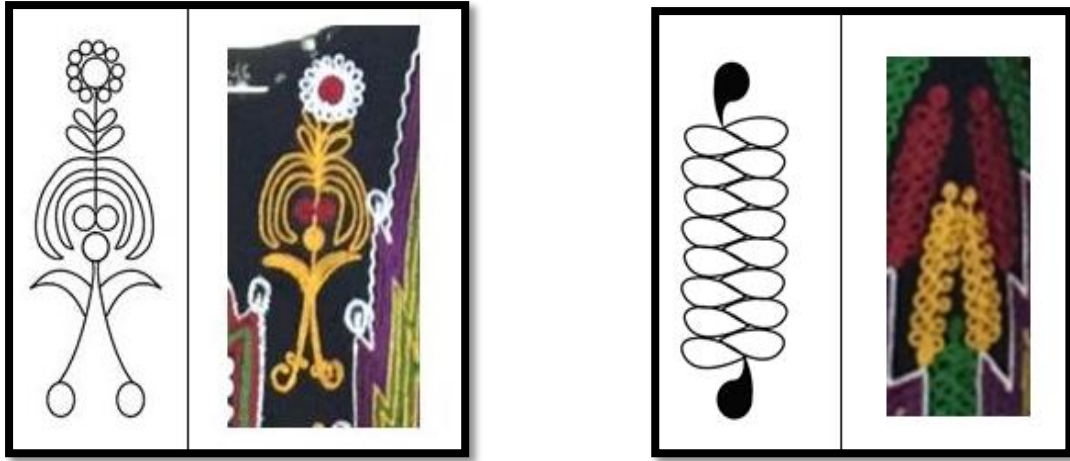
شكل (4) صورة توضيحية للزخارف النباتية (السنبله) شكل (5) صورة توضيحية للزخارف الرمزية (سيف)