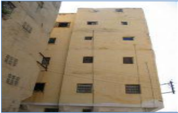
صورتان رقم (2) و(3): يوضحان العلو المفرط للبنىات

أفرزت نتائج البحث الميداني أن أغلب السكن بالحي من النوع الصلب وقد تم البناء بمواد صلبة كالإسمنت والحديد وذلك بنسبة 87% فيما السكن الهش والمختلط يمثلان على التوالي 7% و 5%. كما يتميز السكن بامتداد عمودي مفرط كما يوضح الرسم البياني والصورتين.