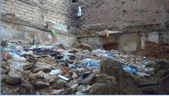
صورة رقم (6) التخلص من النفايات في الأماكن الفارغة بين المنازل